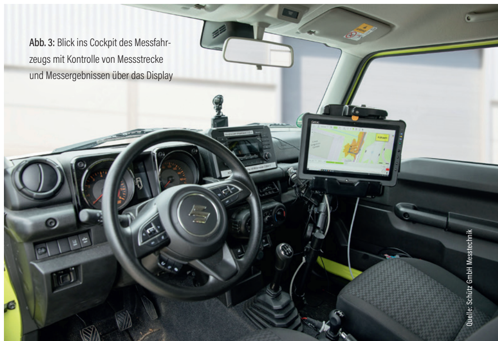
Abb. 3: Blick ins Cockpit des Messfahrzeugs mit Kontrolle von Messstrecke und Messergebnissen über das Display

Im Vergleich zu anderen Systemen mit Windsensorik zeichnet sich das Messsystem LDEM 2000 durch einen geringen technischen Integrationsaufwand aus. Die Notwendigkeit großer, speziell ausgerüsteter Fahrzeuge entfällt. Die Datenerhebung erfolgt DSGVO-konform und kann vollständig im System des Netzbetreibers verarbeitet werden. Aufgrund seiner robusten Bauweise und Unempfindlichkeit gegenüber vielen Umwelteinflüssen eignet sich das System auch für den Einsatz in schwierigem Gelände. Die quantitative Erfassung von Methan und Ethan ist im LDEM 2000 standardmäßig integriert und erlaubt eine umfassende Bewertung des Leckagepotenzials sowie der Emissionsmenge. Die kontinuierliche Echtzeitvisualisierung der Abdeckbereiche während der Befahrung ermöglicht eine direkte Überprüfung der Messstrategie und erfasst das Netz-