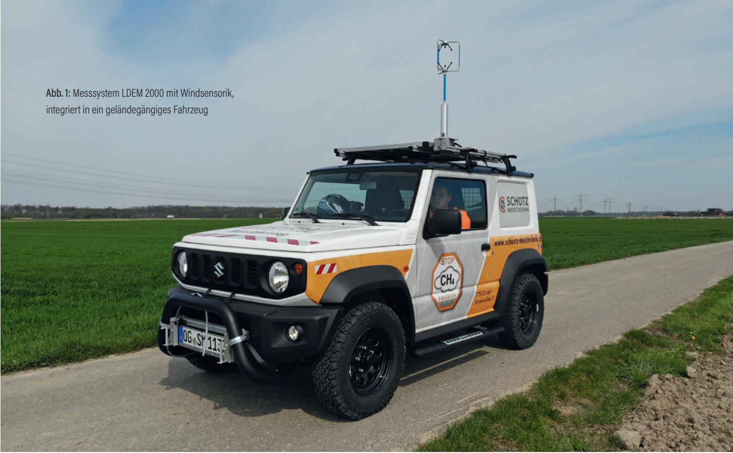
Abb. 1: Messsystem LDEM 2000 mit Windsensorik, integriert in ein geländegängiges Fahrzeug