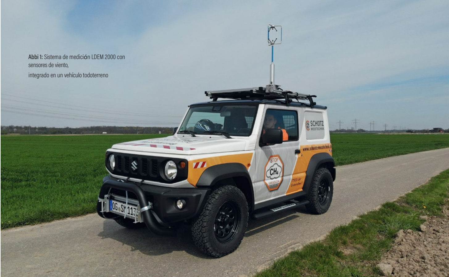
Abbi 1: Sistema de medición LDEM 2000 con sensores de viento, integrado en un vehículo todoterreno