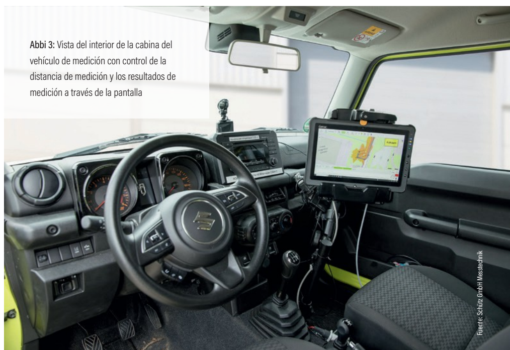
Abbi 3: Vista del interior de la cabina del vehículo de medición con control de la distancia de medición y los resultados de medición a través de la pantalla

En comparación con otros sistemas con sensores de viento, el sistema de medición LDEM 2000 se caracteriza por un bajo esfuerzo de integración técnica. No es necesario utilizar vehículos grandes y especialmente equipados. La recopilación de datos se realiza de conformidad con el RGPD y puede procesarse íntegramente en el sistema del operador de red. Gracias a su diseño robusto y a su resistencia a numerosas influencias ambientales, el sistema también es adecuado para su uso en terrenos difíciles. El registro cuantitativo de metano y etano está integrado de serie en el LDEM 2000 y permite una evaluación exhaustiva del potencial de fuga y de la cantidad de emisiones. La visualización continua en tiempo real de las áreas cubiertas durante la inspección permite una verificación directa de la estrategia de medición y registra la red