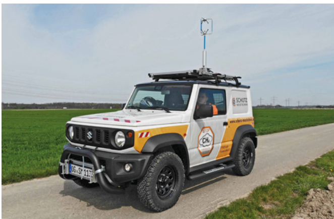
Bild 1: Messsystem LDEM 2000 mit Windsensorik integriert in geländegängiges Fahrzeug